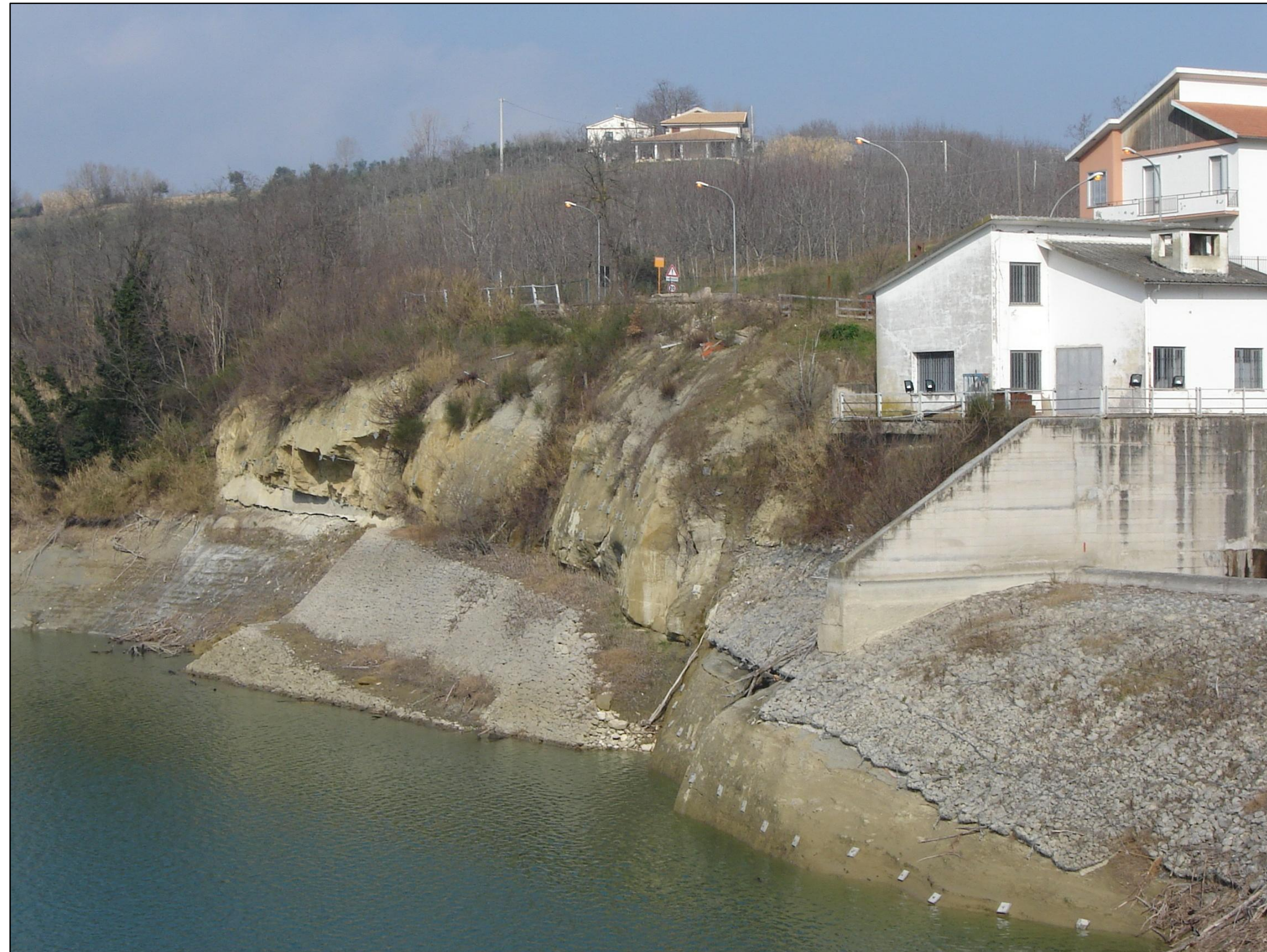
LA SPONDA SINISTRA DELL'INVASO DALLO SFIORATORE (A DESTRA) ALLA ZONA DELL' INTERVENTO DI PROGETTO (A SINISTRA)

NOTA: SONO EVIDENTI GLI INTERVENTI ESEGUITI CON IL PROGETTO 1997 IN CORRISPONDENZA DELLO SFIORATORE E DELLA CABINA DI MANOVRA E L'INTERVENTO PRECEDENTE AGNI ANNI '90 SEMPRE TRA LA CABINA DI MANOVRA E L'AREA DELL' ATTUALE PROGETTO. IN CORRISPONDENZA DI QUESTA SI POSSONO OSSERVARE: IL SOTTOSCAVO ALLA BASE DEL BANCO DI ARENARIE, LE NICCHIE FORMATESI NEL BANCO STESSO PER EFFETTO DEI CROLLI, LE ESTREMITA' DENUDATE DEI CHIODI GIA' APPLICATI CON IL PROGETTO 1997.